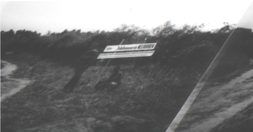
Op de plantage werden bordjes geplaatst van de verenigingen die gesteund hebben. Zo staat er ook een bordje van Telebouworde Neerharen.